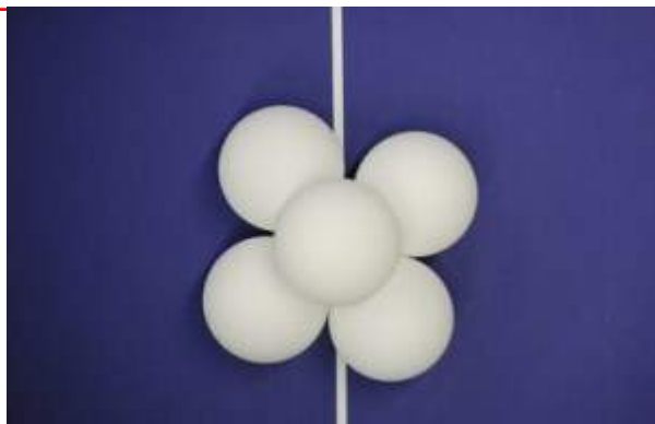
Zelluloid und Plastik: Aus dieser Entfernung kaum zu unterscheiden

Mehr zum Thema finden Sie HIER beim DTTB.