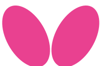
TABLE TENNIS FOR YOU 卓球をあなたへ