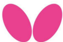
TABLE TENNIS FOR YOU 卓球をあなたへ