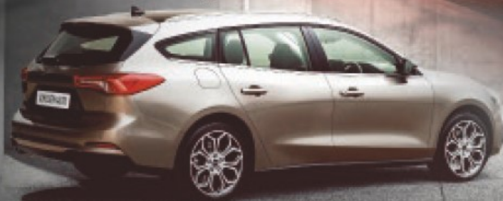
FORD FOCUS TURNIER FÜR MTL. 379€