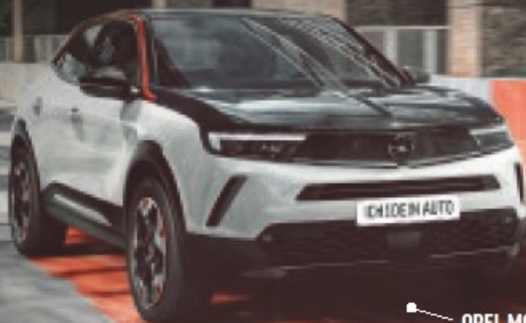
OPEL MOKKA FÜR MTL. 349€

WIR GEBEN SEIT 1997 ALLES FÜR EUCH, DAMIT IHR ALLES FÜR EUREN SPORT GEBEN KÖNNT.