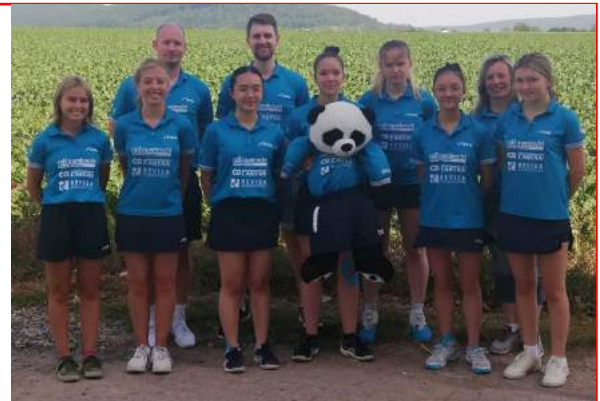
Die Mädchen 18 der Neckarsulmer Sportunion sind Deutscher Vizemeister!

Alle Informationen finden Sie auf unserer Homepage .