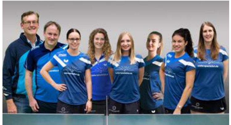
Kann der VfL Sindelfingen am Samstag gegen Wombach den ersten Saisonsieg einfahren?

13.11.22 16:00 TTC Bietigheim-Bissingen II - SV Niklashausen